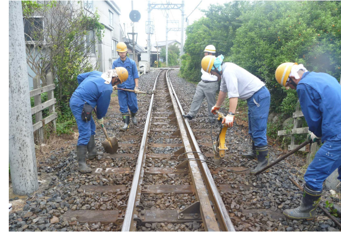
北勢線軌道保守整備状況