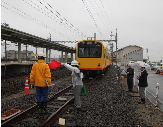
北勢運転区乗務員訓練

年末年始輸送安全総点検（毎年 12 月 10 日～翌年 1 月 10 日）の際、運転事故や信号故障、災害を想定した訓練を実施しています。