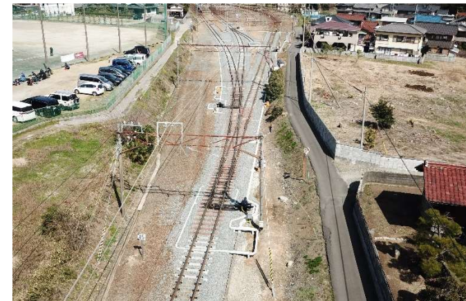
三岐線 伊勢治田駅構内重軌条化工事