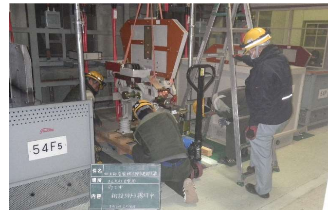
北勢線 変電所設備更新工事