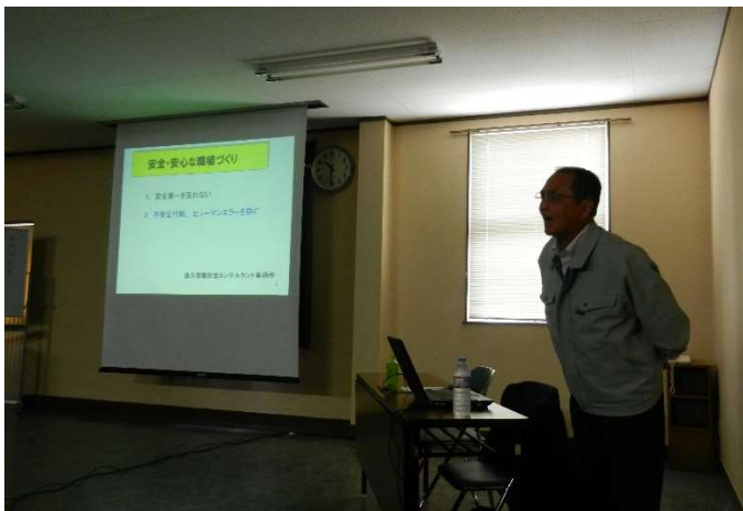
会社主催安全大会