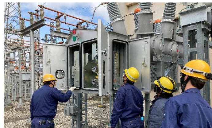
北勢線 北大社変電所機器更新工事