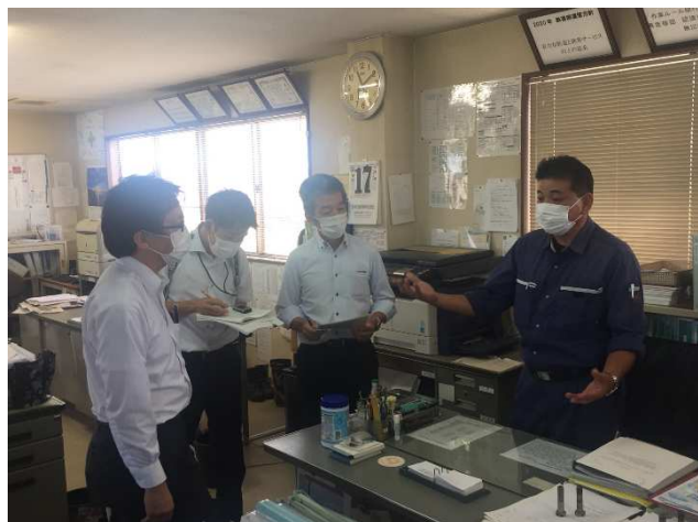
内部監査実施状況

当社では鉄道部門の安全管理体制の点検活動の一つとして、総務部長を監査責任者とする内部監査を毎年8月に実施しており、安全管理体制の強化並びに改善を図っています。