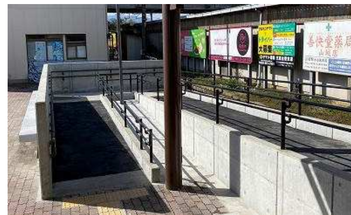
三岐線 暁学園前駅バリアフリー化工事