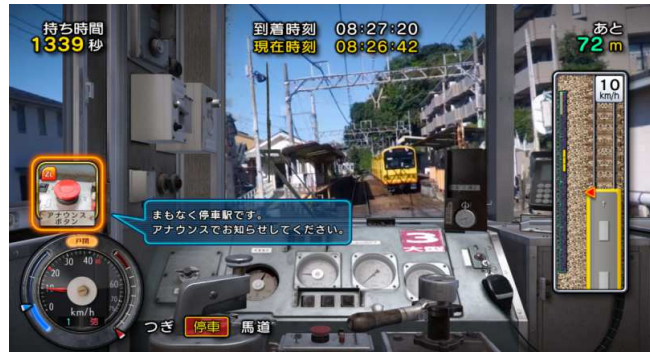
【ワンマン！なりきり運転】アナウンス・ドアの開閉操作に挑戦