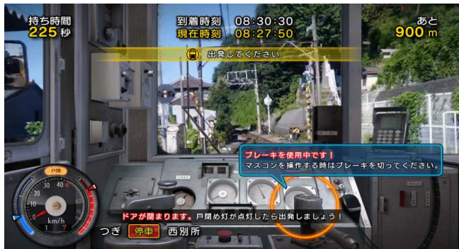
【区間走行】ガイド機能でサポート

従来のマスコンとブレーキを使用した運転方法はそのままに、駅から発車する際に 車内アナウンスの放送とドアの開閉が操作可能 になりました！本物の運転士になったつもりで安全運転を心がけましょう！