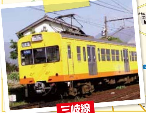
このマップは略図になります。