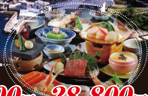
創作会席の夕食イメージ