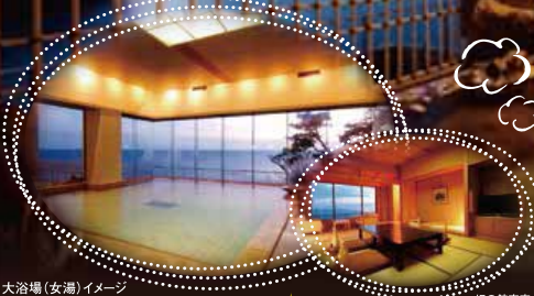
大浴場(女湯)イメージ