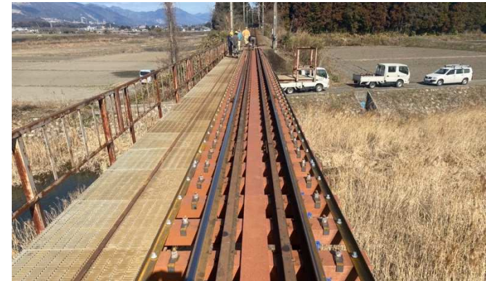
北勢線 山田川橋梁合成マクラギ化工事