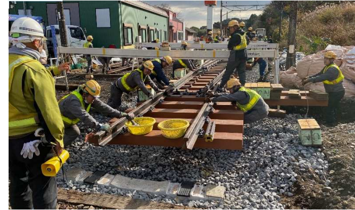
三岐線 西藤原駅構内分岐器重軌条化工事