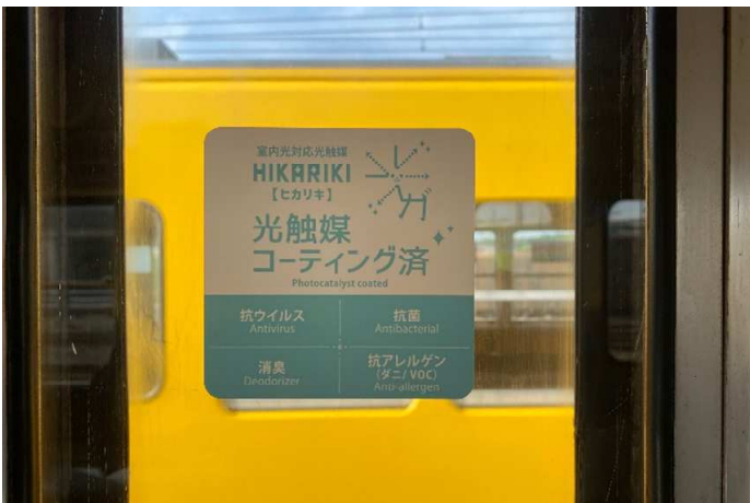
光触媒コーティング「ヒカリキ」施工済証